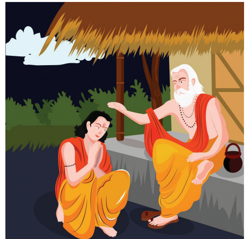
चित्र 1.2 : गुरु से आशीर्वाद लेते हुए

आज गुरु-शिष्य संबंधों पर नए ढंग से विचार-विमर्श की आवश्यकता है। गुरु को उच्च स्थान पर प्रतिष्ठापित करके ही हम