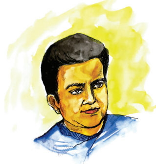
चित्र 7.3 : दुष्यंत कुमार

हम अक्सर अपने आस-पास हो रही घटनाओं पर आपस में चर्चा करते रहते हैं। ऐसी कई बातें हैं जो वर्षों से हमें परेशान करती रही हैं। कुछ लोग समस्याओं के समाधान की कोशिश करते हैं और अधिकांश लोग जैसी व्यवस्था चली आ रही है, उसका चुप रहकर अनुसरण करते रहते हैं, जो कुछ भी घटित हो रहा है उसे जीवन का हिस्सा मान लेते हैं। कवि या लेखक समाज की यथार्थ स्थिति को अपनी रचनाओं के माध्यम से उजागर करते हैं और शासन व व्यवस्था के लिए समाधान भी प्रस्तुत करते हैं।