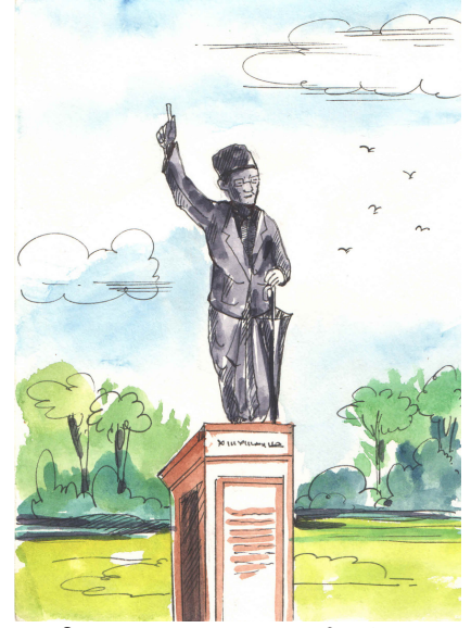
चित्र 17.3 : सावरकर की प्रतिमा

शाम हो चली है। समुद्र पर चिड़ियाँ मँडरा रही हैं। हज़ारों की तादाद में। कौन जानता है, ये हमारे पूर्वजों की मृतात्माएँ हों।