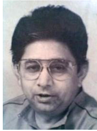
चित्र : 17.4 : श्रीकांत वर्मा