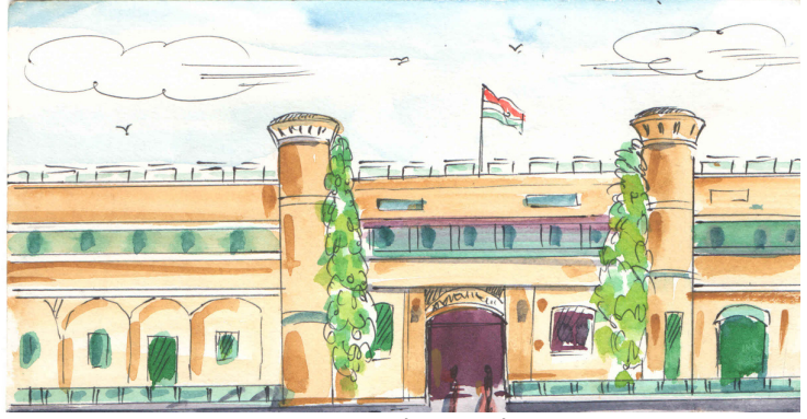
चित्र 17.1 : सेल्लुलर जेल

निकल नहीं सकता और कोई प्रवेश नहीं कर सकता। एक पतली-सी सूरज की किरण को छोड़कर जो संसार को सुखभरी नींद से जगाती है; लोग-बाग अँगड़ाइयाँ लेते, ओंठों पर मुस्कान लिए उठते हैं, किरण जो औरों के लिए आशा