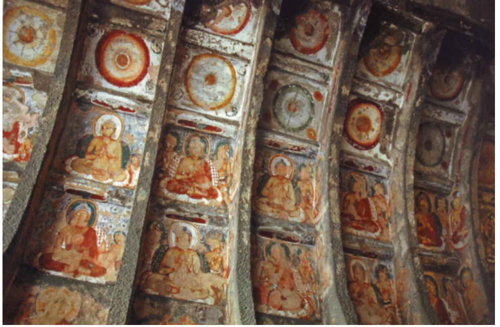
चित्र 3.3: छत की सजावट

छत की सज्जा में मानव-आकृतियों के साथ पशु-पक्षी तथा बेल-बूटों का भी प्रयोग किया गया है। छत को बुद्ध की आकृति से ढक दिया गया है।