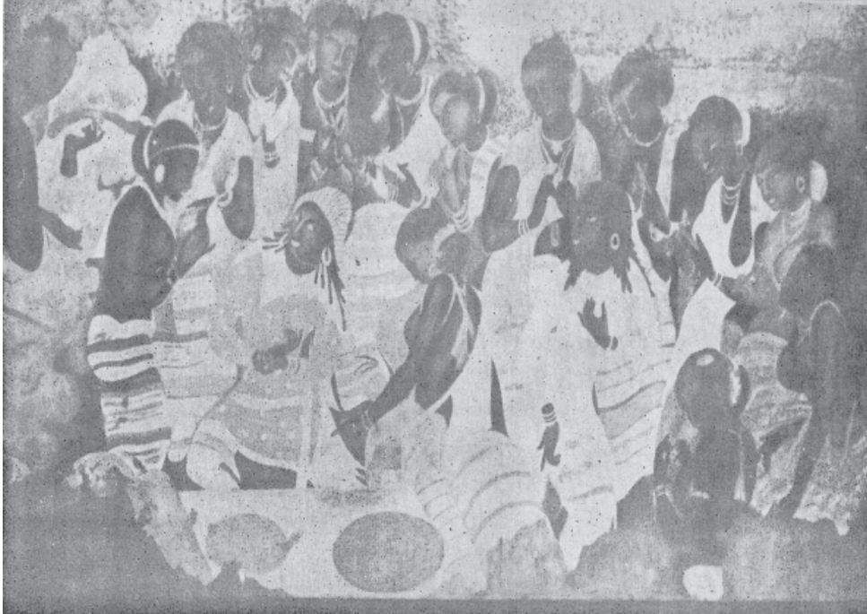
चित्र 3.4: डांसिंग पैनल

यद्यपि अजंता के चित्रकारों ने सामान्य जन-जीवन के उत्सवों और एवं समारोहों का मनोहारी चित्रण किया है। सामान्य रूप से देखें तो इनमें चित्रकार की गहरी निरीक्षण-शक्ति का पता चलता है। अजंता में इस प्रकार की अनेक रचनाएँ हैं जिनसे धर्म निरपेक्ष जीवन प्रदर्शित होता है।