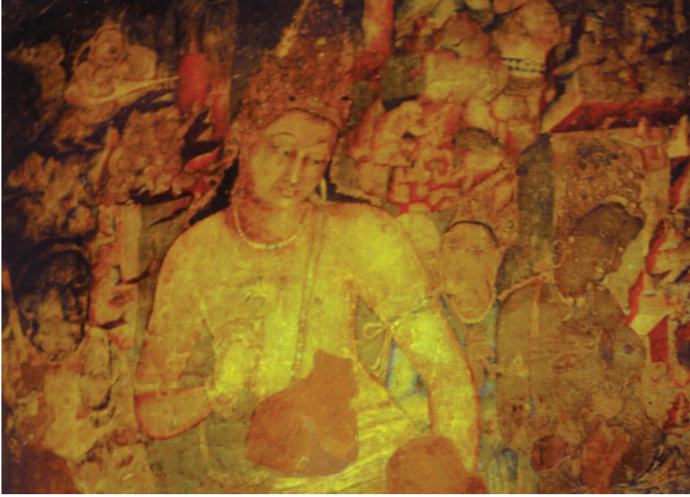
चित्र 3.1: पद्मपाणि बोधिसत्व