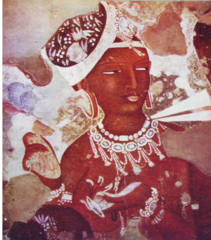
चित्र 3.2: अप्सरा

अजंता के चित्रकारों ने नारी-सौंदर्य के अनेक रूप चित्रित किए हैं। इनमें सामान्य औरतें, राजघराने की स्त्रियाँ, दरबारी स्त्रियाँ, नृत्यांगनाएँ और अप्सराएँ अथवा परियाँ सम्मिलित हैं।