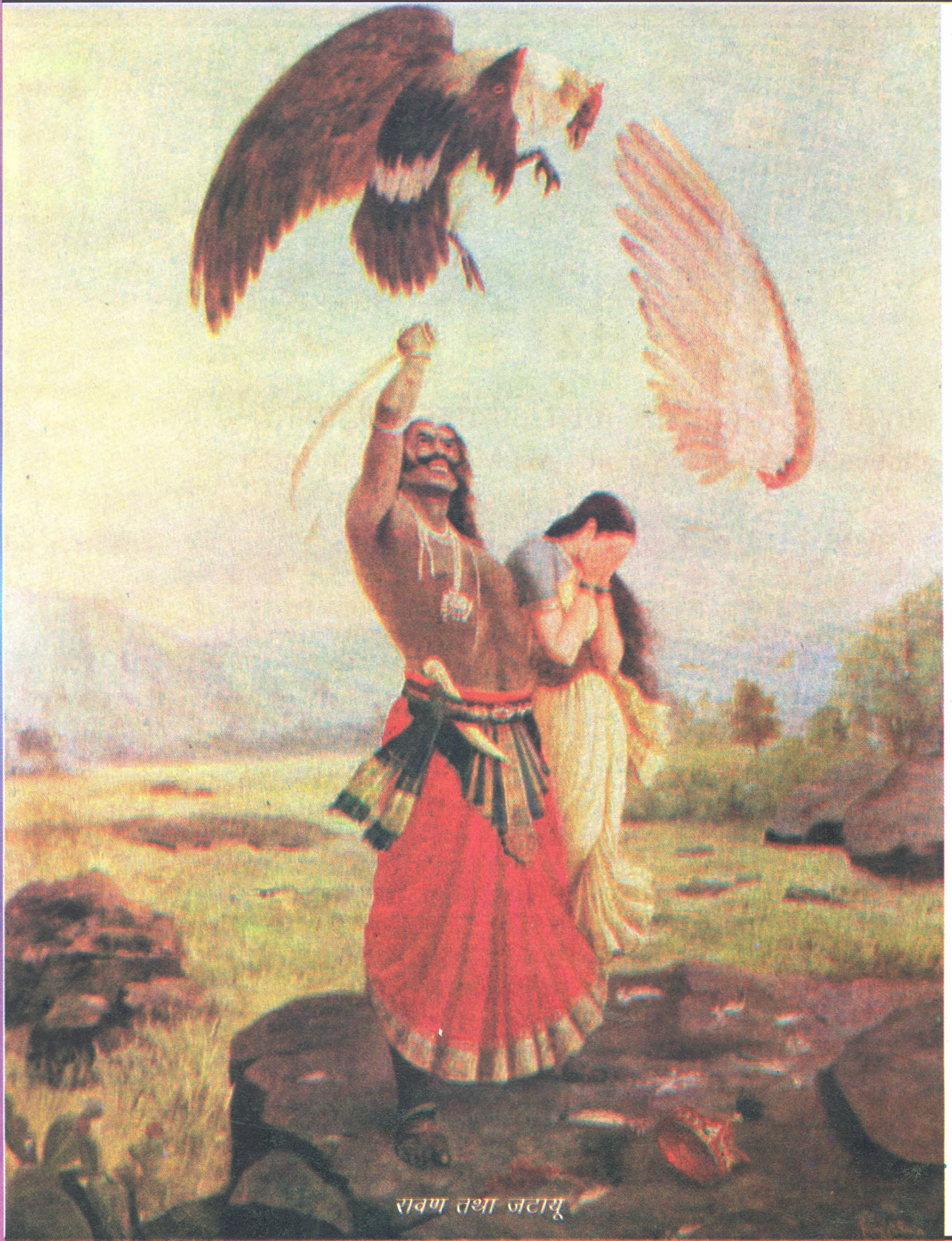
रावण तथा जटायू