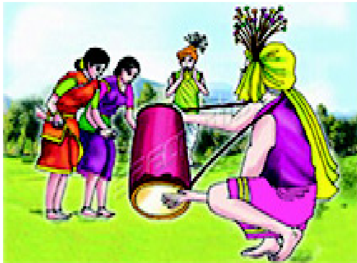
चित्र 2.9 मध्य प्रदेश