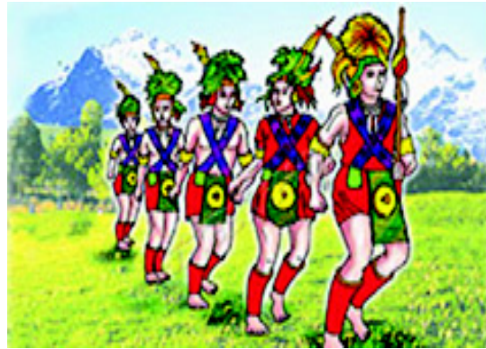
चित्र 3.12 नागालैंड