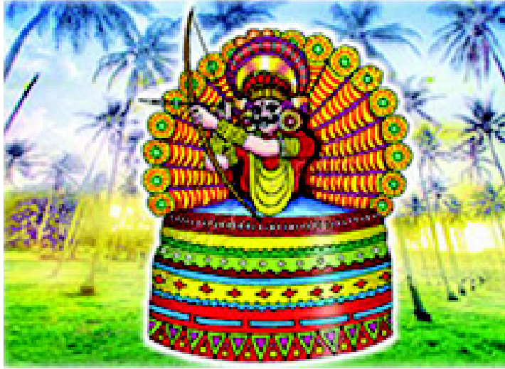
चित्र 3.8 केरल