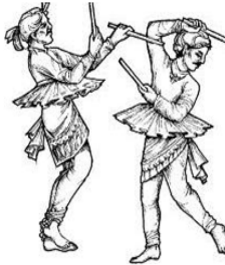
चित्र 3.3 गुजरात