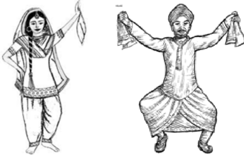
चित्र 3.13 पंजाब