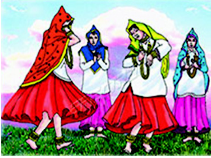
चित्र 3.4 हरियाणा