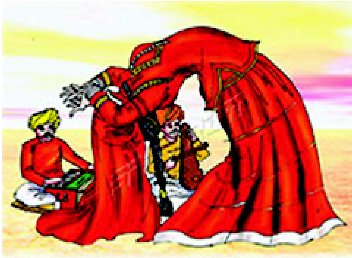
चित्र 3.14 राजस्थान