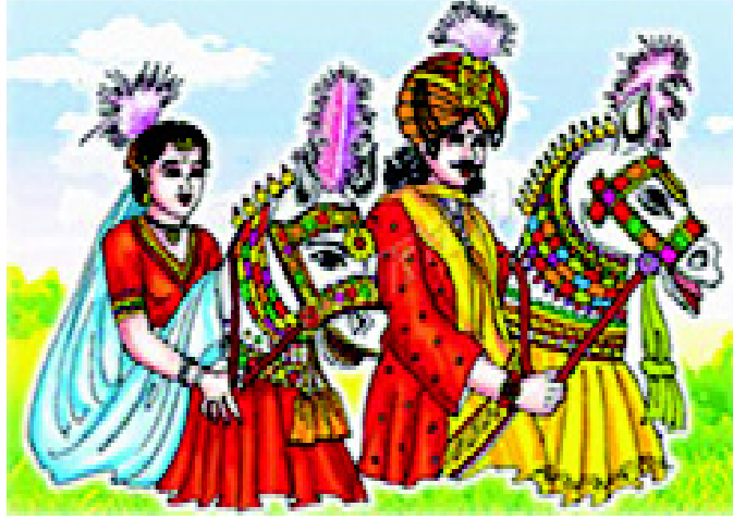
चित्र 3.15 तमिलनाडु