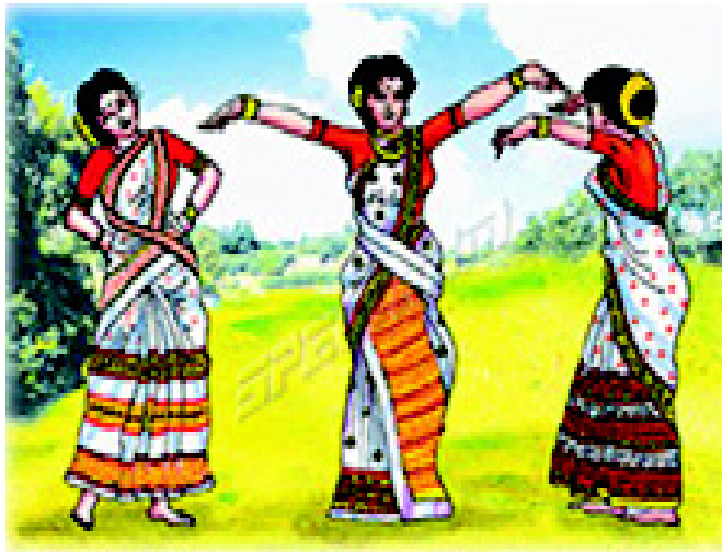
चित्र 3.1 असम