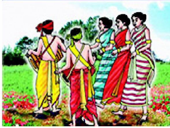
चित्र 3.2 बिहार