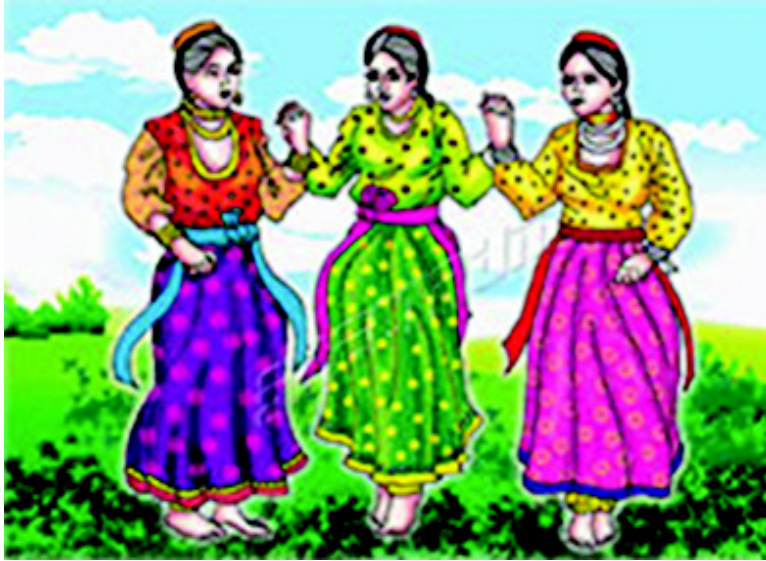
चित्र 3.5 हिमाचल प्रदेश