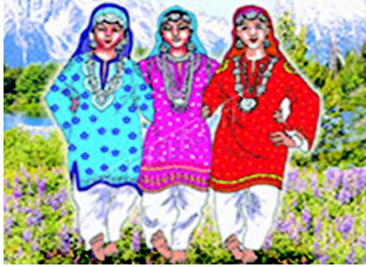
चित्र 3.6 जम्मू और कश्मीर