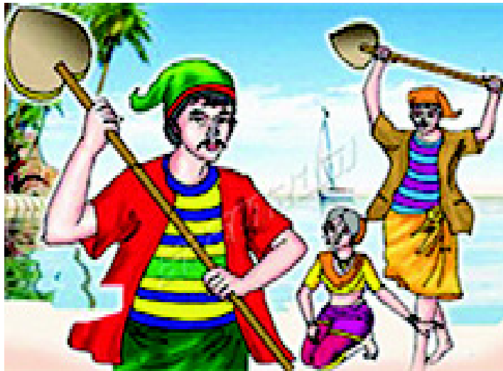
चित्र 3.18 गोवा