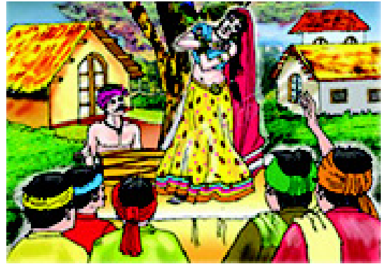
चित्र 3.16 उत्तर प्रदेश