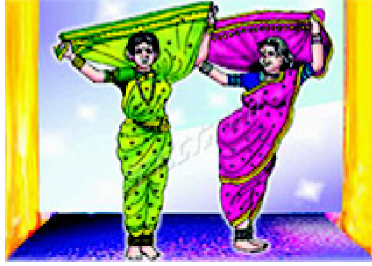
चित्र 3.10 महाराष्ट्र