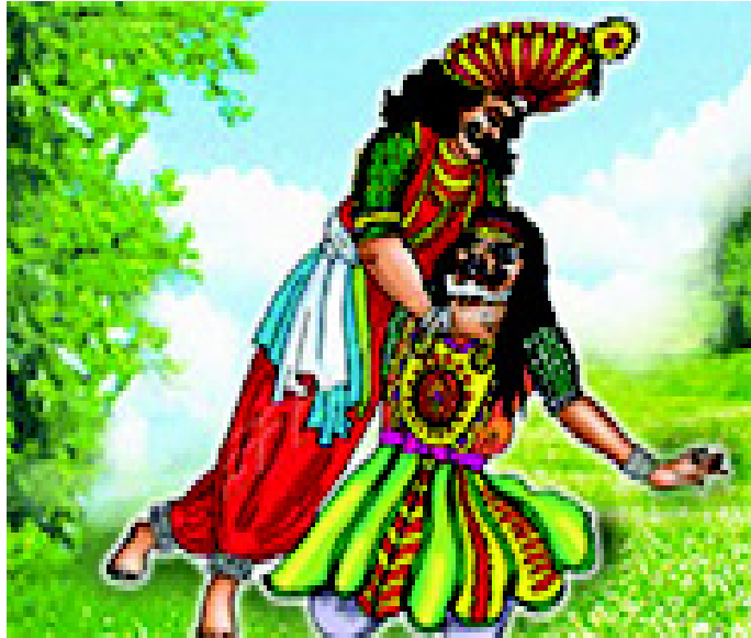
चित्र 3.7 कर्नाटक