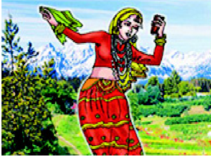
चित्र 3.17 उत्तराखंड