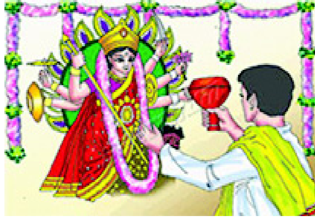
चित्र 3.19 पश्चिम बंगाल