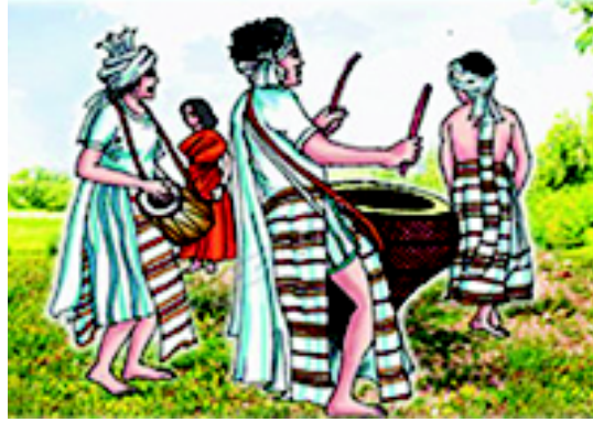
चित्र 3.1 मेघालय