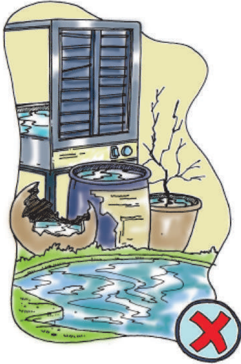
تصویر 8.2 چند احتیاطی تدابیر

(8) عوامی جگہوں اور سینما ہال وغیرہ میں کم سے کم جائیے۔ خاص طور پر اگر کسی بیماری کی وبا پھیلی ہوئی ہو تو بالکل نہ جائیے۔