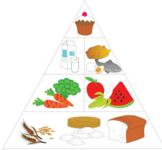
تصویر 8.3: غذائی پیرامیڈ

بہتر صحت حاصل کرنے کے لیے لوگوں کو چاہیے کہ وہ اپنی عادتوں میں تبدیلی لائیں۔ رہن سہن سے جڑی بیماریوں سے محفوظ رہنے کے لیے آپ بہت کچھ خود کر سکتے ہیں۔ کچھ صحت مند گرج درج ذیل ہیں۔