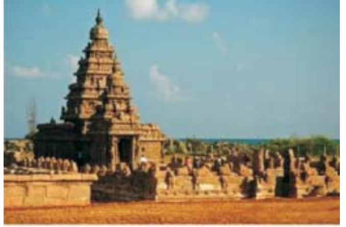
चेन्नई के निकट महाबलिपुरम में स्मारकों का समूह

प्राचीन भारत का इतिहास दक्षिणी भारत के दो प्रमुख वंशों पल्लवों और चोलों की कला, वास्तुकला, प्रशासन और विजयों के उल्लेख के बिना अपूर्ण ही रहेगा। ईसा की प्रारंभिक शताब्दियों में दक्षिण में अनेक वंशों का उदय हुआ। उनमें प्रमुख पल्लव कला और वास्तुकला के बहुत बड़े प्रशंसक थे। उनके द्वारा