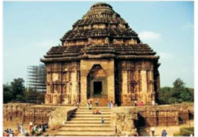
सूर्य मंदिर, कोणार्क, उड़ीसा

मंदिर निर्माण का काम ई.पू. पांचवीं शताब्दी के बाद ही प्रारंभ हुआ। उत्तरी भारत में जो मंदिर बनाए गए, नागर शैली में थे जिनमें घुमावदार शिखर, गर्भगृह (मूर्ति का स्थान) और स्तम्भों से युक्त बड़े हाल आदि बनाए जाते थे जबकि दक्षिण में बने मंदिर द्रविड़ शैली में थे जिनमें विमान अर्थात् शिखर, ऊंची ऊंची