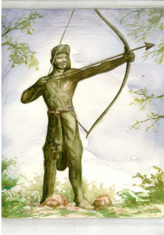
चित्र 7.4 तिरका मांझी