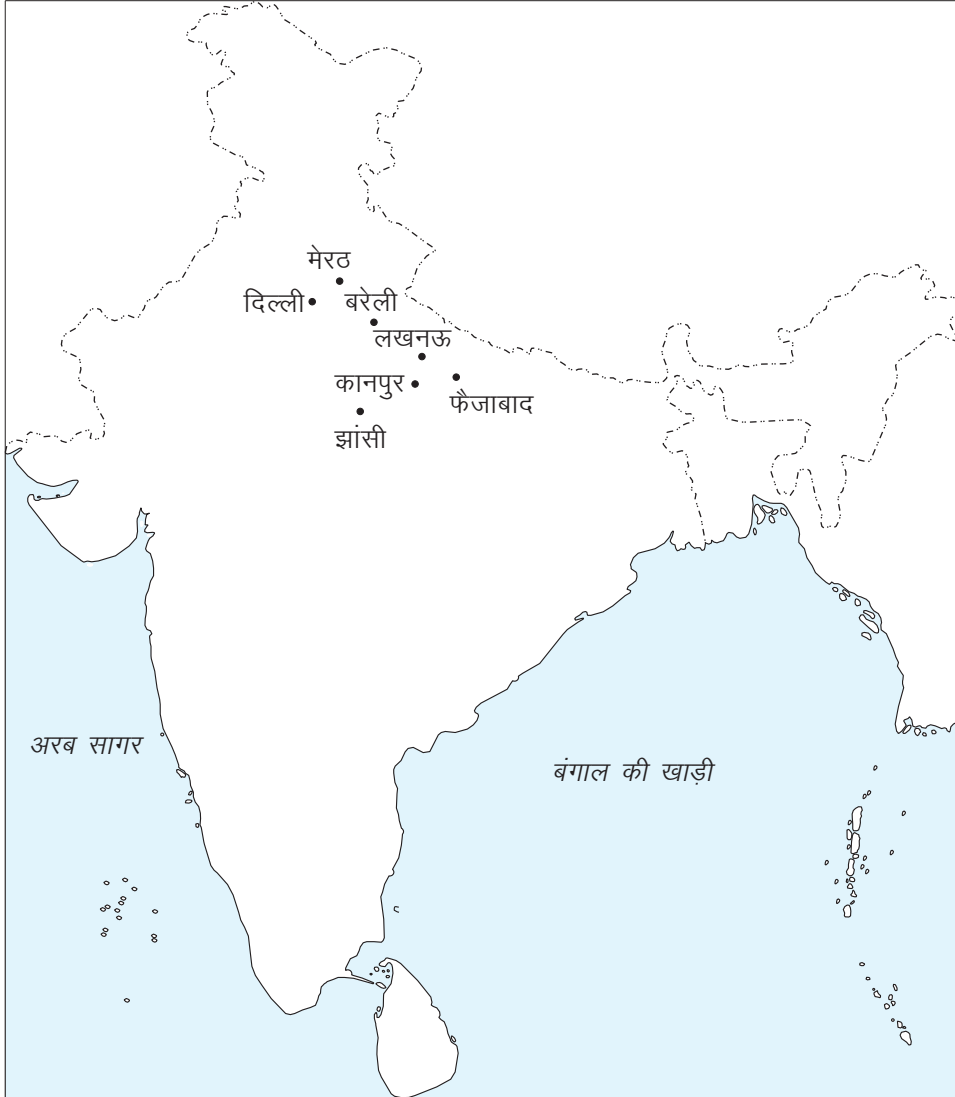
चित्र 7.7 1857 के विद्रोह के प्रमुख केन्द्र

और दिल्ली की ओर कूच कर दिया। वे लाल किले में प्रवेश कर गये और उन्होंने वयोवृद्ध और शक्तिहीन मुगल बादशाह बहादुरशाह जफ़र को भारत का सम्राट घोषित कर दिया। यह विद्रोह अंग्रेजों की आक्रामक साम्राज्यिक नीतियों के विरुद्ध, एक बड़ा औपनिवेशीय- विरोधी आंदोलन था। वास्तव में यह आंदोलन अंग्रेजी शासन के विरुद्ध एक आर्थिक, राजनीतिक और सामाजिक संघर्ष था। क्रोध की इस विस्फोटक अभिव्यक्ति और असंतोष ने भारत के बहुत बड़े भाग में औपनिवेशिक शासन की नींव हिलाकर रख दी। अब हम, भारतीय लोगों में अंग्रेजी शासन के विरुद्ध उभरे असंतोष के कारणों के संबंध में अध्ययन करेंगे जिन्होंने विद्रोह करवाया।