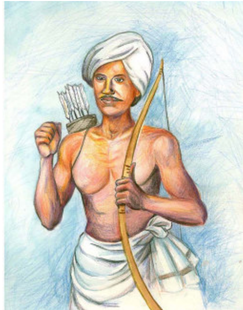
चित्र 7.5 बिरसा मुंडा

1908 के छोटानागपुर काश्तकारी अधिनियम (टीनेंस एक्ट) के अधीन लोगों को भूमि पर कुछ स्वामित्व अधिकार प्रदान किए गए और जनजातियों की बंधुआ मजूदरी पर भी रोक लगा दी गई। बिरसा मुंडा, मुंडा विद्रोह के निर्माता और एक ऐसे व्यक्ति बन गए जिन्हें आज भी याद किया जाता है।