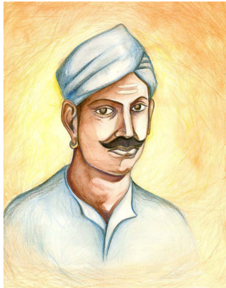
चित्र 7.8 मंगल पाण्डे

मंगल पाण्डे पहला ऐसा सैनिक था जिसने खुले रूप में आदेशों का उल्लंघन किया। कलकत्ता के पास बैरकपुर में 29 मार्च 1857 को उसने दो अंग्रेज अफसरों की हत्या कर दी। उसे गिरफ्तार करके उस पर मुकदमा चलाया गया और फांसी दे दी गई। बैरकपुर की रेजीमेंट को तोड़ दिया गया। मंगल पाण्डे का समाचार बहुत जल्दी देश के दूसरे भागों तक पहुंच गया और परिणामस्वरूप खुले विद्रोह भड़क उठे। सबसे निर्णायक विद्रोह मेरठ में हुआ जहाँ पर घुड़सवार (कैवेलरी) रेजीमेंट के 85 सैनिकों को चर्बी वाले कारतूसों का प्रयोग करने से इंकार करने पर 2-10 वर्षों के कारावास की सजा दे दी गई। इसके अगले ही दिन अर्थात् 10 मई 1857 को तीन रेजीमेंटों ने खुली बगावत कर दी। उन्होंने अंग्रेज अफसरों की हत्या कर दी और अपने साथी सैनिकों को छुड़ाने के लिए जेलों को तोड़ दिया। उन्होंने दिल्ली की ओर कूच (मार्च) शुरू कर दिया, जहाँ उनके साथ स्थानीय पैदल सेना और सामान्य लोग भी मिल गए। बागियों ने दिल्ली पर कब्जा कर लिया और अनेक अंग्रेज अफसरों की हत्या कर दी। उन्होंने मुगल बादशाह बहादुरशाह को भारत का सम्राट घोषित कर दिया।