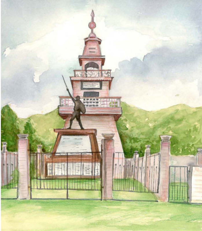
चित्र 7.6 यू कियांग नाँगवाह स्मारक