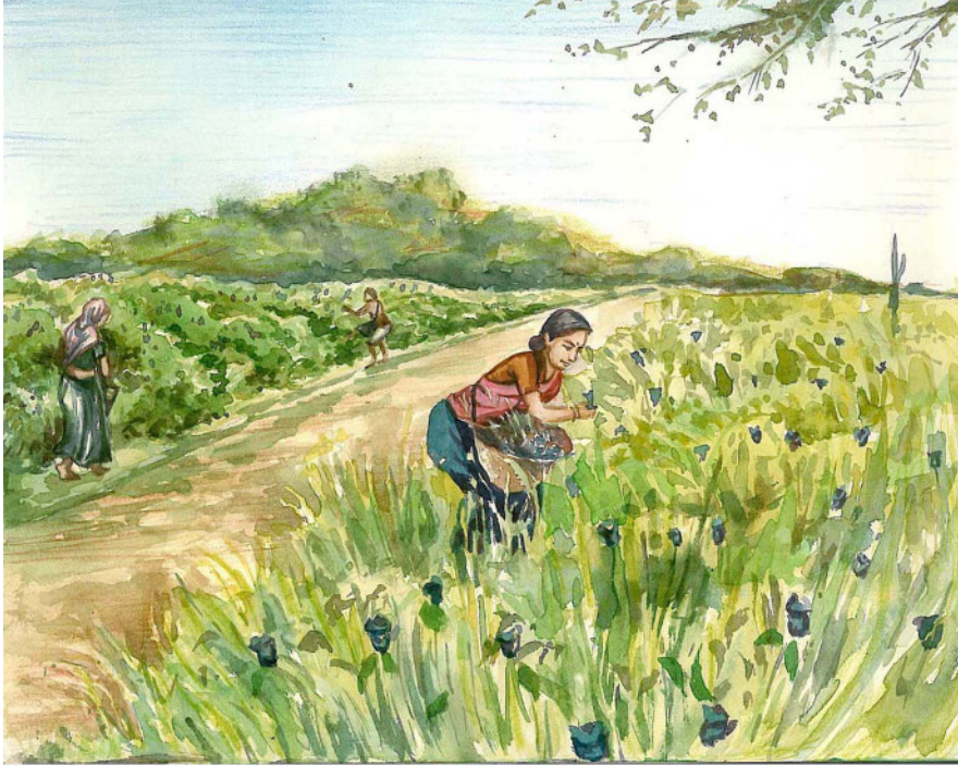
चित्र 7.3 : बंगाल में नील की कृषि

तो बहुत सस्ते दामों पर बेचने के लिए निर्भर होना पड़ता था। उन्होंने जमींदारों को अपना वर्चस्व बनाये रखने और उनके द्वारा शासित क्षेत्रों में उनकी समस्याओं के समाधान करने के लिए समर्थन दिया। किसानों ने बंगाल में नील की खेती न किए जाने के लिए एक अभियान चलाया। हिन्दु और मुसलमान किसानों ने मिलकर हड़तालें की और सबने मिलकर मालिकों पर कानूनी केस दर्ज करा दिए। प्रैस और मिशनरियों ने इनका समर्थन किया। नवम्बर 1860 में सरकार ने आदेश जारी किया, जिसमें अधिसूचित किया गया कि रैय्यतों को नील की खेती करने के लिए बाध्य करना गैर-कानूनी है। विद्रोहियों के लिए इसे बड़ी जीत माना गया।