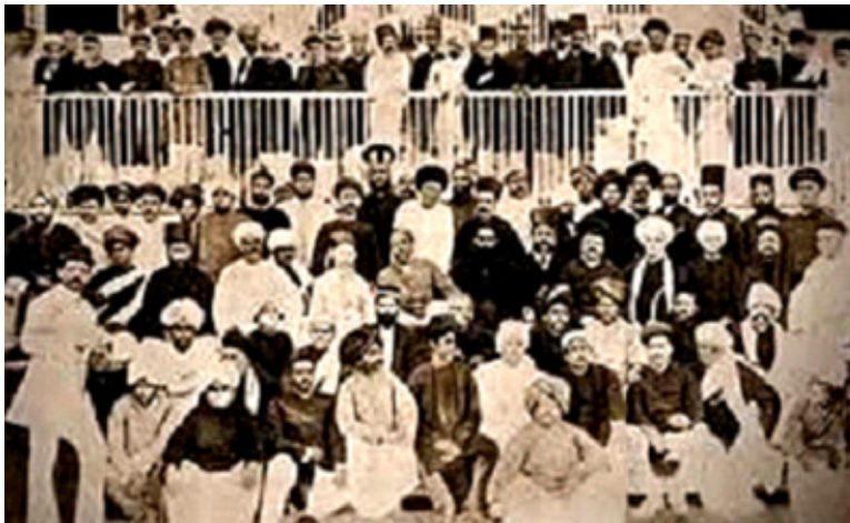
चित्र 8.1 भारतीय राष्ट्रीय कांग्रेस अधिवेशन 1885

भारतीय राष्ट्रीय कांग्रेस की स्थापना 1885 में एलेन ऑक्टावियन ह्यूम द्वारा की गई। ह्यूम एक सेवानिवृत्त सिविल सेवा अधिकारी थे। उसने भारतीयों में राजनीतिक सजगता को बढ़ते देखा और वे इसे एक सुरक्षित संवैधानिक स्वरूप देना चाहते थे ताकि उनका असंतोष भारत में अंग्रेजी शासन के विरुद्ध सार्वजनिक क्रोध के रूप में विकसित न हो सके। इस योजना में उन्हें वायसराय लॉर्ड डफरिन एवं प्रसिद्ध भारतीयों के एक समूह की मदद मिली। कलकत्ता (कोलकाता) के वामेश चन्द्र बनर्जी इसके पहले अध्यक्ष के रूप में चुने गए। भारतीय राष्ट्रीय कांग्रेस राजनैतिक रूप से सजग भारतीयों का उनकी बेहतरी के लिए काम करने के लिए राष्ट्रीय संगठन स्थापित करने के लिए काम करने के हेतु विचार रखते थे। इनके नेताओं का ब्रिटिश सरकार और इसके न्याय में पूरा विश्वास था। वे मानते थे कि यदि वे सरकार के सामने तर्क पूर्ण ढंग से शिकायत रखेंगे तो अंग्रेज निश्चित रूप से उनमें सुधार करेंगे। इन उदार नेताओं में सबसे प्रसिद्ध फिरोजशाह मेहता, गोपाल कृष्ण गोखले, दादा भाई नौरोजी, रास बिहारी बोस, बदरुद्दीन तयैबजी इत्यादि थे। 1885 से 1905 तक भारतीय राष्ट्रीय कांग्रेस का बहुत संकीर्ण सामाजिक आधार था।