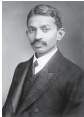
चित्र 8.3 मोहनदास करमचन्द गाँधी

मोहनदास करमचन्द गाँधी एक ब्रिटेन से प्रशिक्षित वकील थे। वे 1893 में दक्षिण अफ्रीका गए और वहाँ इक्कीस वर्षों तक रहे। अंग्रेजों द्वारा दक्षिण अफ्रीका में भारतीयों के साथ दुर्व्यवहार ने उनकी अंतरात्मा को झकझोड़ दिया। उसने दक्षिण अफ्रीकी सरकार के जातीय विभेद के खिलाफ लड़ने का निर्णय किया। सरकार से संघर्ष करने के दौरान उसने सत्याग्रह (सत्य और न्याय के लिए अहिंसक विरोध) की तकनीक विकसित की। गाँधीजी दक्षिण अफ्रीका में इस संघर्ष में सफल रहे। वे 1915 में भारत लौटे। 1916 में उन्होंने सत्य के विचार एवं अहिंसा पर अभ्यास के लिए अहमदाबाद में साबरमती आश्रम की स्थापना की। गोपाल कृष्ण गोखले ने उन्हें देश भ्रमण मुख्यतः गावों में लोगों और उनकी समस्याओं को समझने की सलाह दी। सत्याग्रह में उनका प्रथम प्रयोग बिहार के चम्पारण में 1917 में प्रारंभ हुआ यहाँ वे किसानों की समस्याओं को सुनने के लिए आमंत्रित किए गए थे। इस समझ के आधार पर उसने चम्पारण, खेड़ा और अहमदाबाद के स्थानीय हलचल का सफलतापूर्वक नेतृत्व किया।