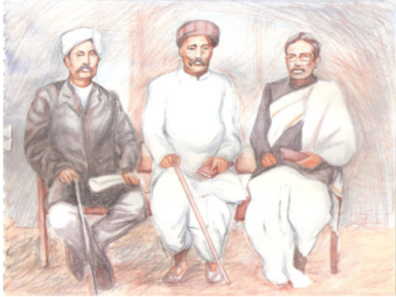
चित्र 8.2 लाल-बाल-पाल

गरमदल का यह विश्वास था कि अंग्रेज भारतीयों का शोषण करते हैं, उसकी आत्म-प्रचूरता को नष्ट करते हैं और भारत का धन ले जाते हैं। वे अनुभव करते थे कि अब भारतीयों को खुद सरकार चलानी चाहिए। ये गरमपंथी गुट सरकार को दरखास्त करने के बदले बड़े पैमाने पर विरोध करने, सरकार की नीतियों की आलोचना करने, विदेशी वस्तुओं का बहिष्कार करने, स्वदेशी (गृह-निर्मित) वस्तुओं का उपयोग करने आदि में विश्वास करते थे। वे स्वतंत्रता के लिए सरकार की दया पर निर्भर नहीं थे लेकिन वे यह विश्वास करते थे कि यह उसका अधिकार है। बाल गंगाधर तिलक ने नारा दिया “आजादी मेरा जन्म सिद्ध अधिकार है और हम इसे लेकर रहेंगे।” 1916 में दोनों समूह पुनः एनी बेसेन्ट के प्रयास से एक हुए। क्या आपको उनके बारे में याद है जो आप पहले के अध्याय में पढ़ चुके हैं? उन्होंने 1914 में होमरूल आन्दोलन के लिए काम करना शुरू किया। उनके द्वारा बताया गया कि भारत को स्वशासन दिया जाना चाहिए। 1916 में मुस्लिम लीग और कांग्रेस भी वैचारिक तौर पर परस्पर नजदीक आए और लखनऊ एक्ट पर हस्ताक्षर किए। बाद में महात्मा गाँधी, जवाहर लाल नेहरू सुभाष चन्द्र बोस भारतीय राष्ट्रीय कांग्रेस के प्रसिद्ध चेहरे हुए जिन्होंने स्वतंत्रता संघर्ष को आगे बढ़ाया।