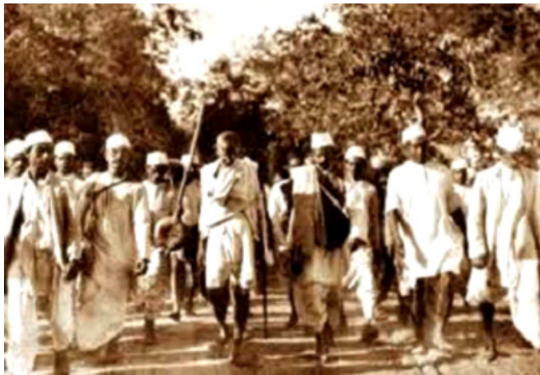
चित्र 8.5: दांडी मार्च के दौरान गांधी

उसी समय सरकार ने एक नया कानून बनाया। उन्होंने नमक के उपयोग पर टैक्स लगा दिया जिसका लोगों ने विरोध किया क्योंकि नमक लोगों की मूलभूत आवश्यकता थी। लेकिन लोगों की माँग पर कोई ध्यान नहीं दिया गया। मार्च-अप्रैल 1930 के समय गाँधी जी ने अपने साबरमती आश्रम से गुजरात के तट दांडी तक सरकार के नमक कानून को तोड़ने के उद्देश्य से यात्रा की। यह एक शांतिपूर्ण यात्रा थी। गाँधीजी ने 06 अप्रैल 1930 को नमक कानून को कुशलतापूर्वक तोड़ने के लिए मन बना लिया था। 06 अप्रैल 1930 को उन्होंने बिखड़े पड़े समुद्री नमक को उठाकर इस कानून को तोड़ा। इस आंदोलन में किसान व्यापारी तथा औरतों ने भी बड़ी संख्या में हिस्सा लिया। सरकार ने उन्हें मई 1930 में गिरफ्तार कर लिया तथा पूना के यरवदा जेल में रख दिया। इस यात्रा का पूरी बदलती दुनिया पर और अंग्रेजों की भारतीय प्रवृत्ति पर बहुत महत्वपूर्ण असर हुआ। 1931 का गाँधी-इरविन समझौता उसी का एक उदाहरण था। गाँधीजी 1931 में कांग्रेस के एकमात्र प्रतिनिधि बनकर गोलमेज सम्मेलन में भाग लेने इंग्लैंड भी गए।