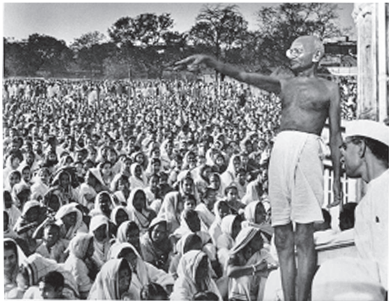
चित्र 8.4: महात्मा गांधी राष्ट्रीय आंदोलन के दौरान

उस समय तक, गाँधीजी समझते थे कि सरकार को समर्थन देकर कोई उपयोगी काम नहीं हो सकता। बीती घटनाओं के प्रकाश में और ब्रितानी सरकार के कार्य के बाद, उन्होंने सरकार के सामने कुछ मांगें रखी। जैसे, सरकार को अमृतसर की घटनाओं पर पछतावा व्यक्त करना चाहिए, इसे तुर्की के प्रति उदार प्रवृत्ति दर्शानी चाहिए और भारतीयों की संतुष्टि के लिए सुधार की नई योजनाएँ प्रारंभ करनी चाहिए। यदि सरकार उनके माँगों को स्वीकार में असफल हुई उन्होंने असहयोग आंदोलन प्रारंभ करने की धमकी दी। सरकार ने इस पर कोई ध्यान नहीं दिया। इस प्रकार गाँधी ने अपना असहयोग आंदोलन अगस्त 1920 में प्रारंभ किया जिसमें उन्होंने लोगों से ब्रितानी सरकार का साथ न देने की अपील की। इसी समय, मुस्लिमों के द्वारा प्रारंभ खिलाफत आंदोलन और गाँधी के नेतृत्व में असहयोग आंदोलन मिलकर ब्रिटिश सरकार के खिलाफ एक मोर्चा बना। इसके लिए गाँधीजी ने एक विस्तृत कार्यक्रम तय किया (1) पदवी तथा सम्मान लौटाना, कार्यालय तथा स्थानीय निकाय के पदों से त्यागपत्र। (2) कार्यालय और गैर कार्यालय के कार्यों में उपस्थित होने से इनकार। (3) सरकार के द्वारा संचालित विद्यालयों तथा कॉलेजों से धीरे-धीरे छात्रों को हटाना। (4) वकीलों के द्वारा ब्रिटिश न्यायालय का बहिष्कार आदि। (5) सैनिक, लिपिक तथा मजदुर वर्गों की सेवा की नियुक्ति का इनकार (6) विधानसभा के चुनाव में प्रत्याशी तथा मतदाताओं का बहिष्कार (7) विदेशी सामानों का बहिष्कार