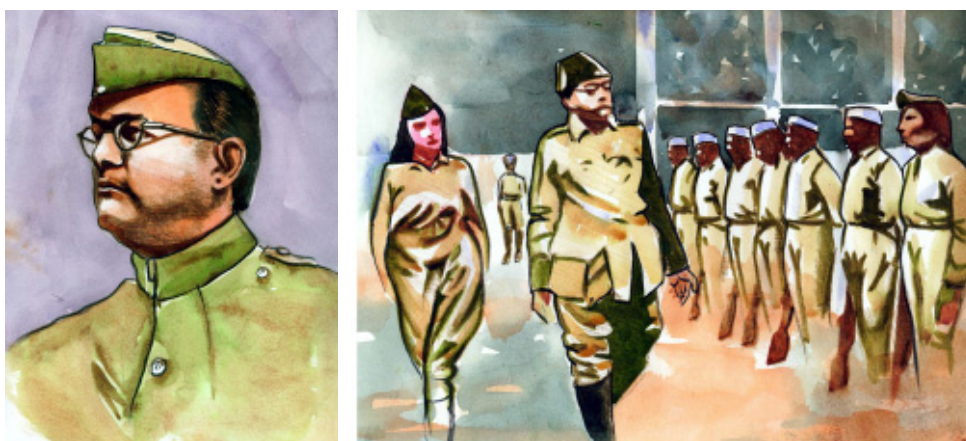
चित्र 8.7: सुभाष चन्द्र बोस और आजाद हिन्द फौज

सुभाषचन्द्र बोस द्वारा विदेश से स्वतंत्रता के लिए संघर्ष को चलाया गया। उन्होंने द्वितीय विश्व युद्ध की शरूआत को भारत की स्वतंत्रता के लिए अंग्रेजों पर चोट करने का एक सुविधाजनक अवसर पाया। बोस को 1940 में उनके घर में ही कैद कर दिया गया लेकिन 28 मार्च 1941 को वे बर्लिन निकल भागने में सफल रहे। वहाँ भारतीय समुदाय में उन्हें 'नेताजी' के रूप में सम्मान दिया गया। उनका 'जय हिन्द' से स्वागत किया गया। उन्होंने एक भारतीय सेना की शुरुआत की कोशिश की और अपने देश के लोगों को ब्रिटिश के विरुद्ध हथियार उठाने को प्रेरित किया। 1942 में इंडियन इंडिपेंडेंस लीग की स्थापना की गई और भारत को आजादी के लिए इंडियन नेशनल आर्मी के गठन का निर्णय लिया गया। रासबिहारों बोस के एक आमंत्रण पर 13 जून 1943 को सुभाष चन्द्र बोस पूर्वी एशिया आए। उन्हें इंडियन इंडिपेंडेंस लीग का अध्यक्ष और आइ.एन.ए. जिन्हें आजाद हिन्द फौज कहा जाता है, के अध्यक्ष बनाया गया। उन्होंने प्रसिद्ध युद्ध घोष 'चलो दिल्ली' दिया। उन्होंने भारतीयों से स्वतंत्रता का वादा यह कहते हुए किया कि 'तुम मुझे खून दो मैं तुम्हें आजादी दूँगा।' मार्च 1944 में कोहिमा में भारतीय झंडा फहराया गया। दुर्भाग्यवश, आन्दोलन खत्म हो गया। अगस्त 1945 में एक हवाई दुर्घटना में सुभाष की मृत्यु की सूचना दी गई। लेकिन आई.एन.ए. ने भारतीय स्वतंत्रता संघर्ष में एक सम्मानित स्थान पर अपना कार्य करता रहा। बोस एवं आई.एन.ए. की सेना की अति देशभक्ति ने भारतीय लोगों के लिए प्रेरणा का बहुत बड़ा स्रोत सिद्ध हुआ।