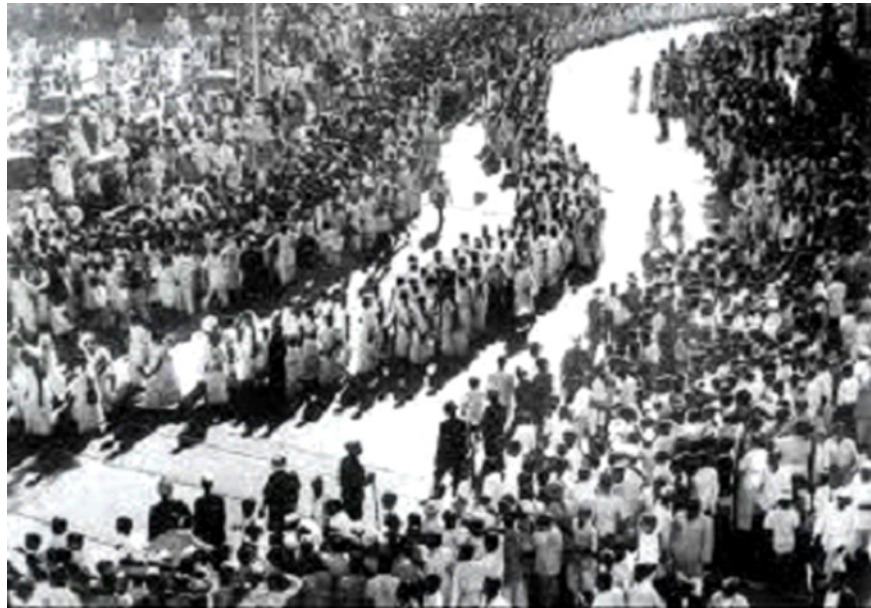
चित्र 8.8: भारत छोड़ो आंदोलन (अगस्त 1942)

जनप्रिय नेताओं की गिरफ्तारी की खबर ने राष्ट्र को सदमे में डाल दिया। उनका क्रोध और असंतोष असंख्य विरोधों, हड़तालों, जुलूसों और विरोध प्रदर्शनों द्वारा देश के सभी भागों में व्यक्त हुआ। अधिकांश नेताओं के जेलों में होने से आन्दोलन ने विभिन्न जगहों पर विभिन्न रूप ले लिया। लोगों ने सरकारी भवन, पुलिस स्टेशन, पोस्ट ऑफिस और अन्य कोई भी चीज जो अंग्रेजों के अधिकार में आता था, को जलाकर अपने क्रोध को खुलकर व्यक्त किया। रेल और टेलिग्राफ की लाइनें तोड़ दी गईं। कुछ स्थानों पर जैसे उत्तर प्रदेश के बलिया जिला में, पश्चिम बंगाल