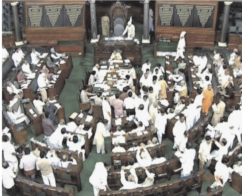
चित्र 20.6 लोक सभा अधिवेशन

लोक सभा का अध्यक्ष स्पीकर कहलाता है और वह लोक सभा की अध्यक्षता करता है तथा उसकी अनुपस्थिति में उपाध्यक्ष अध्यक्षता करता है। लोकसभा सदस्य अपने सदस्यों के बीच से ही अध्यक्ष तथा उपाध्यक्ष का निर्वाचन करते हैं; वह निचले सदन में अनुशासन और व्यवस्था बनाए रखता है तथा कार्यवाही का निरीक्षण करता है। वह यह निर्णय करता है कि कौन-सा सदस्य कितने समय के लिए बोलेगा। आमतौर पर वह मतदान में भाग नहीं लेता परन्तु निर्णय न होने की स्थिति में अपना मत डाल सकता है। अध्यक्ष ही निर्णय करता है कि कौन-सा विधेयक साधारण अथवा धन विधेयक है और उसका निर्णय अन्तिम होता है। वह सदस्यों के अधिकारों तथा सुविधाओं का संरक्षक होता है। लोक सभा और राज्य सभा की संयुक्त बैठक के मामले में लोक सभा का अध्यक्ष ही बैठक की अध्यक्षता करता है।