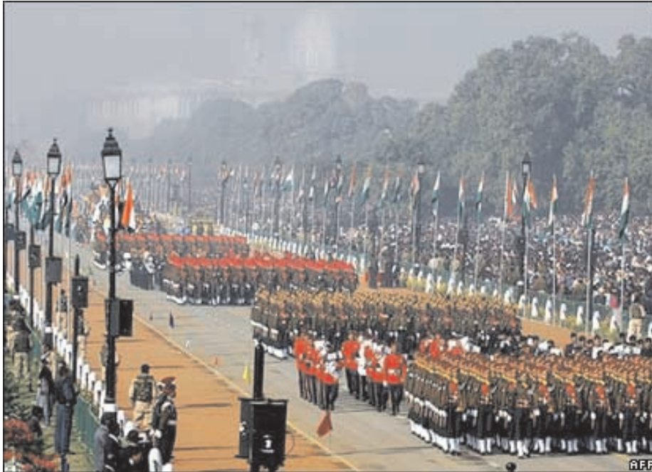
चित्र 20.1 गणतन्त्र दिवस परेड

निम्नलिखित चित्र गणतन्त्र दिवस परेड का है। हम प्रतिवर्ष 26 जनवरी को गणतन्त्र दिवस मनाते हैं। भारत को एक गणतन्त्र के रूप में जाना जाता है। क्या आप इसका कारण जानते हैं? इसका कारण है कि भारत का राष्ट्रपति निर्वाचित होता है। ब्रिटेन में ऐसा नहीं है अपितु वहाँ का राज्य प्रमुख राजा अथवा महारानी होती है। वहाँ यह पद वंशानुगत है।