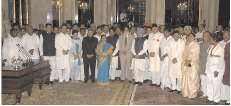
चित्र 20.4 संघीय मन्त्रीपरिषद् के सदस्य शपथ ग्रहण के बाद (2009)