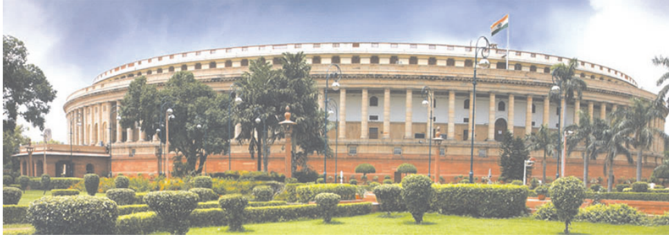
चित्र 20.5 भारत का संसद् भवन