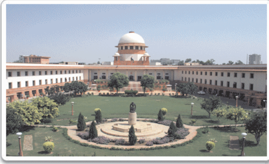
चित्र 20.7 भारत का सर्वोच्च न्यायालय

से बिल्कुल अलग है। क्या आपको न्यायिक कार्रवाइयों का कुछ अनुमान है? आपने कभी सुना होगा कि निचली अदालत में शुरू हुआ कोई वाद बाद में जिला न्यायालय, उच्च न्यायालय और अन्त में सर्वोच्च न्यायालय तक पहुँचा। ऐसा इसलिए होता है कि भारत में एकल और एकीकृत न्याय प्रणाली है। इसका अर्थ है कि यहाँ न्यायालयों की एक शृंखला है जिसमें सबसे ऊपर सर्वोच्च न्यायालय, फिर राज्य स्तर पर उच्च न्यायालय और जिला स्तर पर और इससे नीचे अधीनस्थ न्यायालय होते हैं।