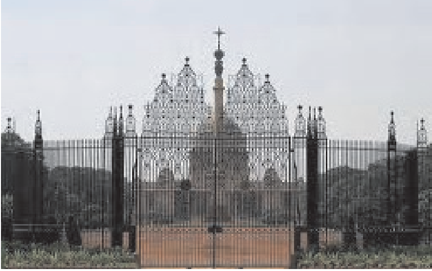
चित्र 20.3 राष्ट्रपति भवन

अनुसार राष्ट्रपति को 10,000 रुपये मासिक वेतन मिलता था जिसे 1998 में बढ़ा कर 50 हजार रुपये कर दिया गया था तथा फिर से 2008 में बढ़ाकर एक लाख पचास हजार रुपये कर दिया गया। इसके अतिरिक्त अन्य कई भत्ते तथा सुविधाएँ भी मिलती हैं और वह नई दिल्ली में स्थित राष्ट्रपति भवन में निवास करता है।