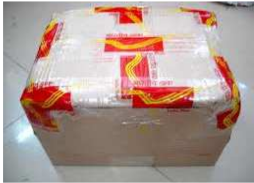
پارسل ڈاک کی ایک تصویر

مان لیجئے آپ کو قریب کے شہر میں رہنے والے دوست کو کتاب بھیجی ہے۔ کیا یہ کام آپ ڈاک کے ذریعے کر سکتے ہیں؟ ہاں، اس کو ڈاک گھر کے ذریعے بھیجا جاسکتا ہے۔ آئیے اس کے متعلق معلوم کریں۔ ڈاک محکمہ کی جن خدمات کے لئے پارسل کی شکل میں چیزیں بھیجی جاسکتی ہیں اسے پارسل ڈاک کہتے ہیں۔ یہ پارسل پہنچانے کا بھروسہ مند اور سستا طریقہ ہے اس کے تحت مخصوص سائز اور وزن کے پارسل ملک اور غیر