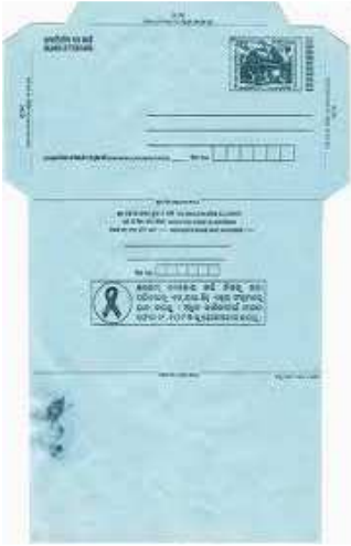
اندرون ملک خط

تحریری پیغام پوسٹ کارڈ کی طرح اندرون ملک خط کے استعمال کے ذریعہ بھیجے جاسکتے ہیں۔ یہ خالی اندرون ملک خط پوسٹ کارڈ بھی ڈاک خانوں سے حاصل کئے جاسکتے ہیں اور ملک بھر میں پیغام بھیجنے کے لئے استعمال کئے جاسکتے ہیں۔ پوسٹ کارڈ کے مقابلے اندرون ملک یا انٹرنیشنل خط کے تحریری حصے کو تہہ کر کے بند کر دیا جاتا ہے۔ صرف خط بھیجنے والے اور پانے والے کا نام و پتہ ہی اس میں نظر آتا ہے۔ اسی طرح یہ پیغام کو مخفی رکھنے میں مدد کرتا ہے لیکن انٹرنیشنل خط میں کسی دوسرے قسم کا کاغذ یا چیز نہیں بھیجی جاسکتی ہے۔ غیر ممالک میں خطوط بھیجنے کے واسطے ایروگرام یا ہوائی خط کا استعمال کیا جاتا ہے جو انٹرنیشنل خط جیسا ہوتا ہے۔