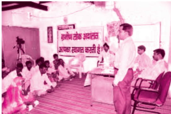
चित्र 16.1: लोक अदालत

लोक अदालत समझौता करने अथवा सौदेबाजी (बातचीत) करने की एक व्यवस्था है। इसको लोगों की अदालत भी कहा जाता है। इसको ऐसी अदालत के रूप में समझा जा सकता है जिसमें किसी विवाद अथवा शिकायत से प्रत्यक्ष अथवा परोक्ष रूप से प्रभावित लोगों को शामिल किया जाता है। सरकार द्वारा स्थापित लोक अदालतें समझा बुझाकर और समझौते से विवाद को हल करती हैं। पहली लोक अदालत 1986 में चेन्नई में हुई थी। लोक अदालत ऐसे मुकद्दों को स्वीकार करती है जो उसके क्षेत्राधिकार में लटके पड़े हैं और उनको समझाने-बुझाने तथा समझौते से हल किया जा सकता है।