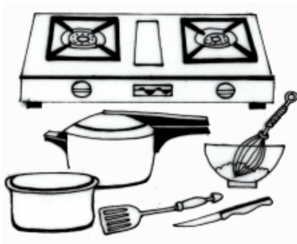
चित्र 16.2: बिना बिजली से चलने वाले उपकरण

इस्त्री, रेफ्रिजरेटर, वाशिंग मशीन, गीजर आदि है जो केवल बिजली से ही चल सकते हैं।