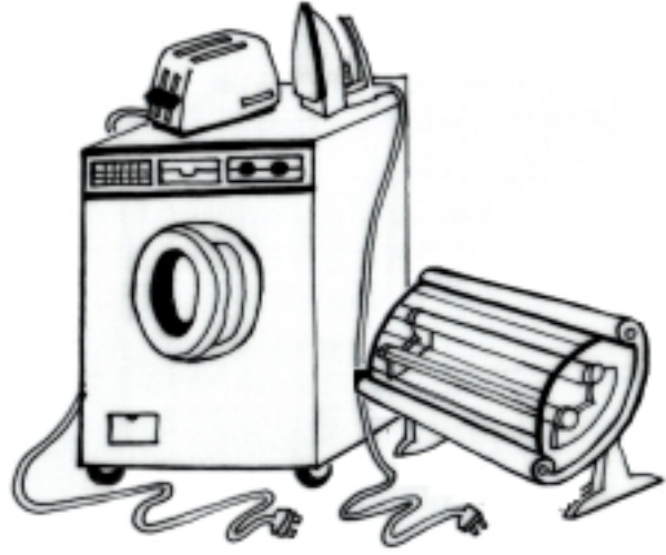
चित्र 16.1: बिजली से चलने वाले उपकरण

उपकरण: अपने घर के चारों ओर देखिये और ऐसे कुछ उपकरणों की पहचान करिये जिन्हें कार्य करने के लिये बिजली की जरूरत पड़ती है। ऐसे कौन से उपकरण हैं। ये उपकरण टोस्टर, मिक्सी, पानी गर्म करने की रॉड,