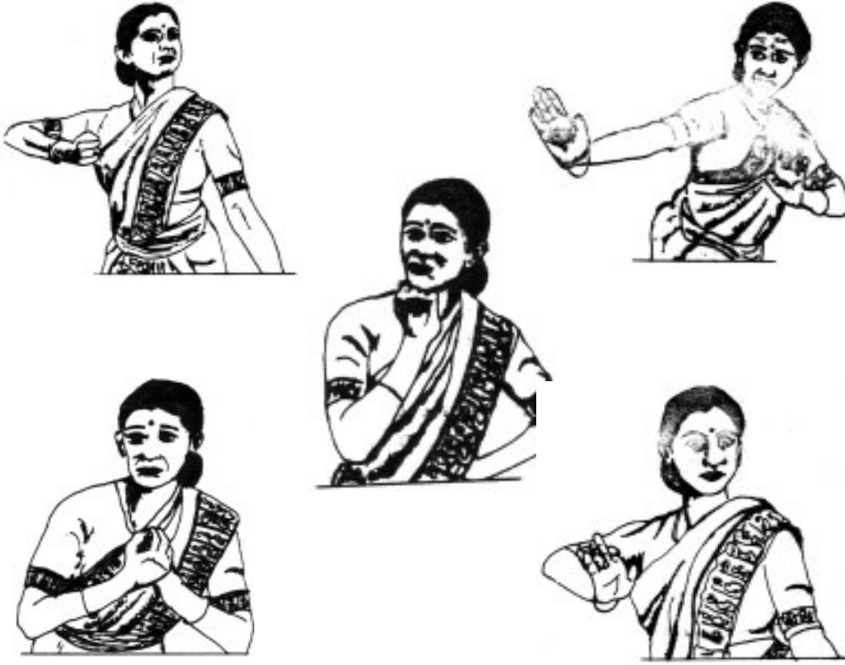
चित्र 10.3: चेहरे के भाव चिड़चिड़ाहट, खुशी तथा क्रोध के संवेगात्मक स्थिति को दर्शाते हैं।

गैर-मौखिक सम्प्रेषण के लिए चेहरे के भाव महत्वपूर्ण होते हैं। उदाहरण के लिए टकटकी लगाकर या एकटक देखकर आप आत्मीयता, अधीनता स्वीकरण या अधिपत्य के भाव का सम्प्रेषण कर सकते हैं। हम विभिन्न संवेगों का अर्थ निकालने के लिए इन गैर-मौखिक संकेतों को पढ़ने में काफी अभ्यस्त होते हैं। हममें से कुछ इन गैर-मौखिक संकेतों के प्रति अन्यों से अधिक संवेदनशील होते हैं।