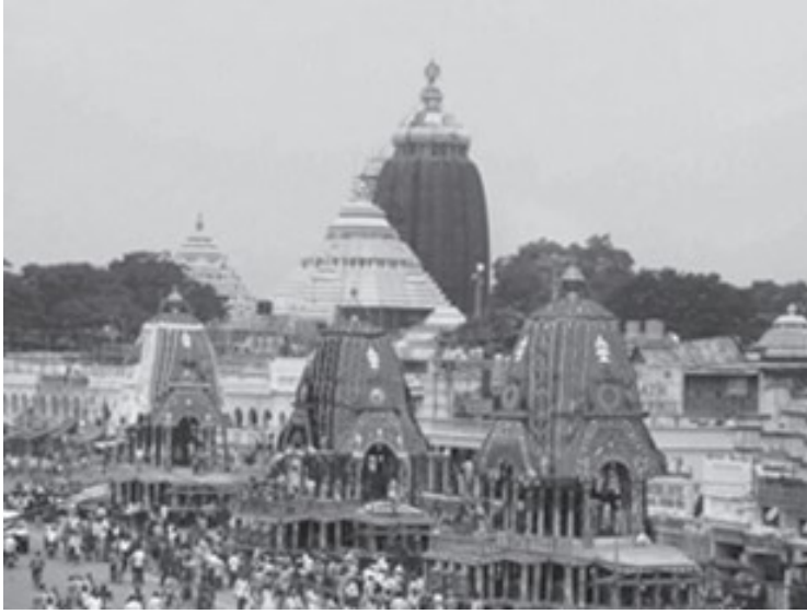
चित्र 9.1: पुरी