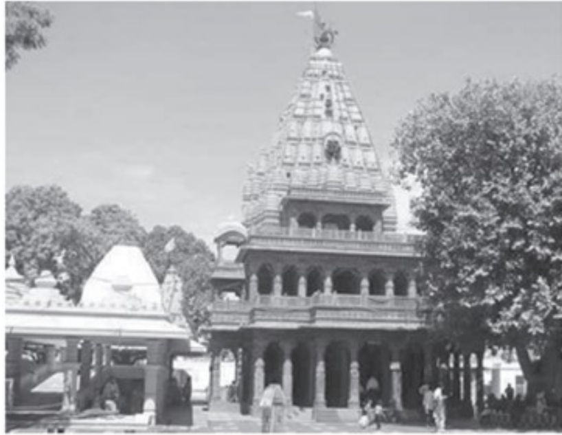
चित्र 9.2: काशी मंदिर

वाराणसी जिसे पहले बनारस या काशी के नाम से जाना जाता था, सभी तीर्थ स्थानों में से सर्वाधिक पवित्र माना जाता है। यह शिव का शहर (स्थान) माना जाता है। यहाँ दो हजार से भी अधिक मंदिर हैं और लगभग पाँच लाख से भी अधिक प्रतिमाएँ हैं। इनमें से अधिकांश शिवजी और उनके परिवार से संबंधित हैं। यह पावन नदी गंगा के तटों पर स्थित है। फ्रेंच यात्री, प्रांकोसी बर्नियर (1656-1668 ईसवी) ने धार्मिक महत्व के अलावा बनारस की शैक्षिक महत्ता के बारे में भी बताया है। बनारस में कई गुरुकुल हैं। उनके शब्दों में, “अत्यंत निर्मल और समृद्ध देश के बीचों बीच स्थित गंगा पर बसा एक खूबसूरत शहर, हिंदुओं का गुरुकुल भी माना जा सकता है। यह भारत का एथेंस है। इस शहर में हमारे विश्वविद्यालयों (यूरोपीय विश्वविद्यालयों) की तरह कोई कॉलेज या नियमित कक्षा का प्रावधान नहीं है परंतु यह प्राचीन काल के विद्यालयों से मिलता-जुलता है। शिक्षक शहर के विभिन्न स्थानों, प्राइवेट घरों और मुख्य रूप से उपनगरों में बिखरे होते थे। कुछ शिक्षकों के पास चार अनुयायी होते थे, तो कुछ के पास छह या सात, जो कि अधिकतम संख्या थी। आमतौर पर लोग अपने गुरु के पास दस-बारह वर्ष तक रहते थे।” आशा करते हैं कि यह जानकारी इन धार्मिक स्थानों के बारे में अधिक जानने, पढ़ने तथा और भी अधिक जानकारी एकत्र करने के लिए प्रेरणा देगी।