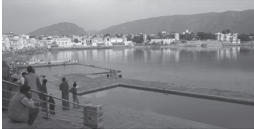
चित्र 9.7: पुष्कर

पुष्कर राजस्थान में स्थित है। यह सबसे पवित्र तीर्थस्थलों में से एक है। इस छोटे से नगर में लगभग 500 मंदिर हैं और यह हिंदुओं का सबसे पवित्र स्थान माना जाता है। भगवान ब्रह्मा का एकमात्र मंदिर पुष्कर में ही स्थित है।