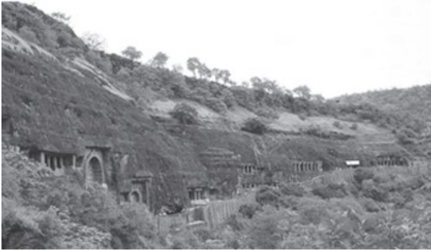
चित्र 9.9: अजंता गुफाएँ

अजंता, औरंगाबाद, महाराष्ट्र : ये बौद्धों की मूल गुफाएँ ईसा पूर्व दूसरी और पहली शताब्दी की हैं। गुप्त काल के समय इन गुफाओं में कई चित्र और प्रतिमाएँ बनीं। अजंता की ये गुफाएँ (20°30' उत्तरी अक्षांश तथा 75°40' पूर्वी देशांतर) औरंगाबाद के उत्तर दिशा में 107 कि.मी. की दूरी पर स्थित हैं। लगभग 12 कि.मी. दूर स्थित अजंता गाँव के नाम पर इन गुफाओं का नाम पड़ा। इन गुफाओं की खोज ब्रिटिश सेना की मद्रास रेजीमेंट के एक आर्मी अफसर द्वारा शिकार के दौरान 1819 में की गई। तभी से अजंता की गुफाएँ बहुत लोकप्रिय हो गईं और यह विश्व भर में एक महत्वपूर्ण पर्यटन गंतव्य स्थान बन गया। ये गुफाएँ, अपनी प्रतिमाओं (भित्ति चित्रों) भारतीय कला के उत्तम नमूनों, विशेषरूप से चित्रकारी के कारण प्रसिद्ध हैं।