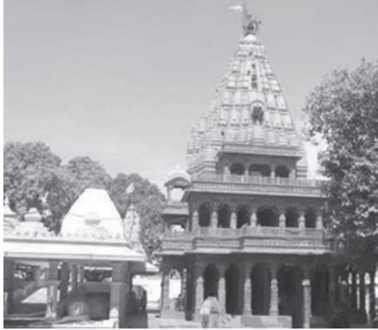
चित्र 9.6: उज्जैन मंदिर

भारत में संस्कृति और धरोहर - I: हिंदू धर्म, जैन धर्म और बौद्ध धर्म