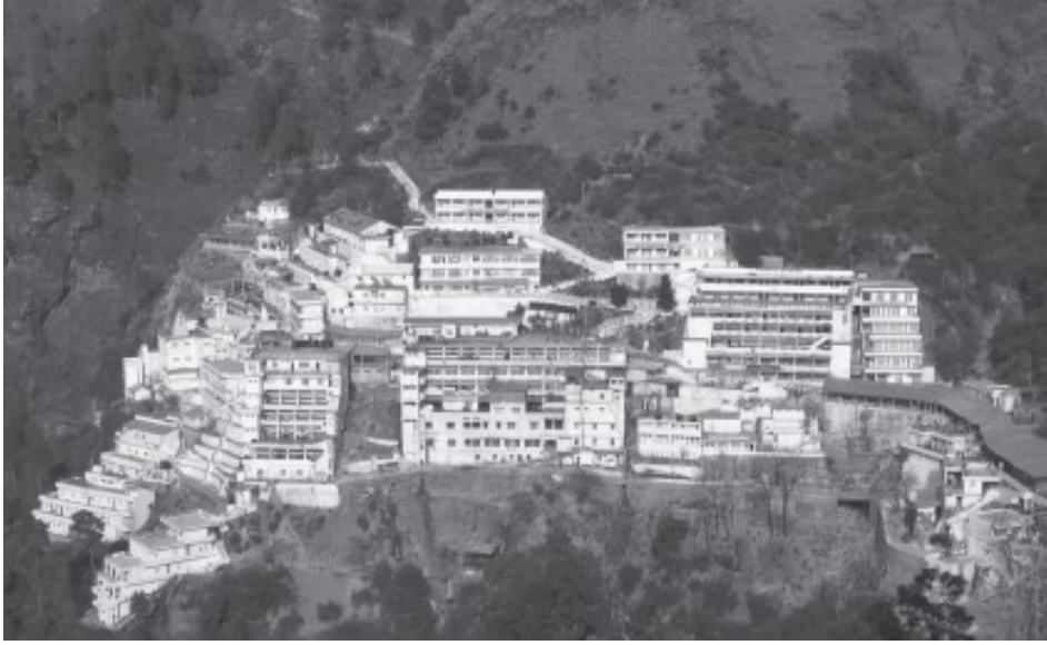
चित्र 9.8: वैष्णो देवी

वैष्णो देवी मंदिर जम्मू से 60 कि. मी. दूर त्रिकुटा की पहाड़ियों पर स्थित है। भारत-भर में यहाँ सबसे अधिक संख्या में भक्त दर्शन और पूजा करने आते हैं।