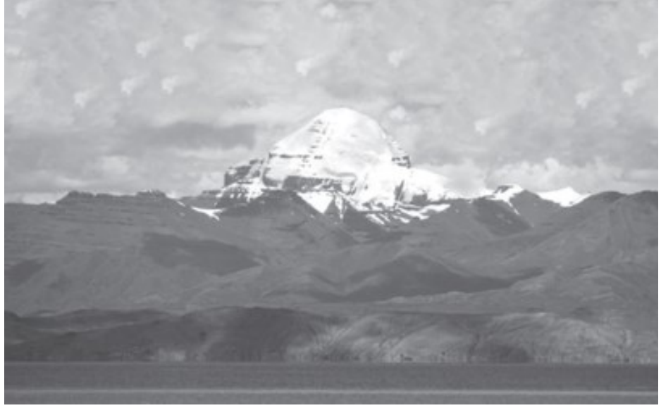
चित्र 9.3: कैलाश पर्वत

कैलाश पर्वत चीन नगरी के दक्षिण-पश्चिमी तिब्बती क्षेत्र में स्थित एशिया का एक पवित्र तीर्थ स्थल है। यह तिब्बत के पठार पर 6714 मीटर की ऊँचाई पर स्थित है। हिंदू पुराणों के अनुसार इसे भगवान शिव का घर भी कहा जाता है।