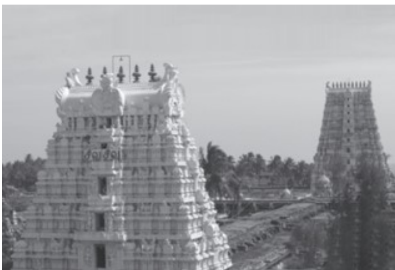
चित्र 9.5: रामेश्वरम मंदिर

रामेश्वरम भारतीय उपद्वीप के दक्षिणतम भाग पर स्थित है। यह हिंदुओं का पवित्र स्थल माना जाता है। पुराणों के अनुसार राजा राम ने अपनी पत्नी सीता जी की खोज के दौरान श्रीलंका तक जाने के लिए यहाँ समुद्र पर पुल बनाया था।