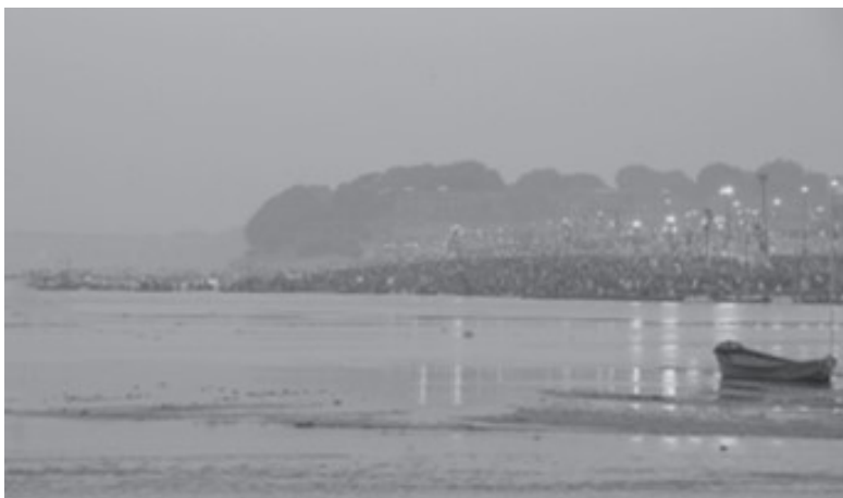
चित्र 9.4: पवित्र गंगा नदी

जगन्नाथ पुरी - हजारों भक्तगणों द्वारा दिव्य रथ को खींचे जाने के आयोजन को देखने के लिए बड़ी संख्या में विदेशी पर्यटक यहाँ पहुँचते हैं। पुरी हिंदुओं के चार पवित्र धामों (पुरी, द्वारका, रामेश्वरम और बद्रीनाथ) में से एक है।