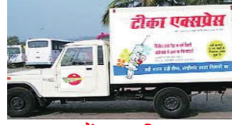
वाहनों द्वारा विज्ञापन