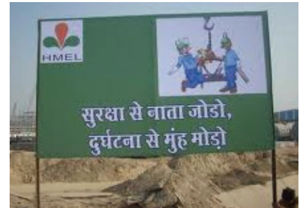
होर्डिंग द्वारा विज्ञापन