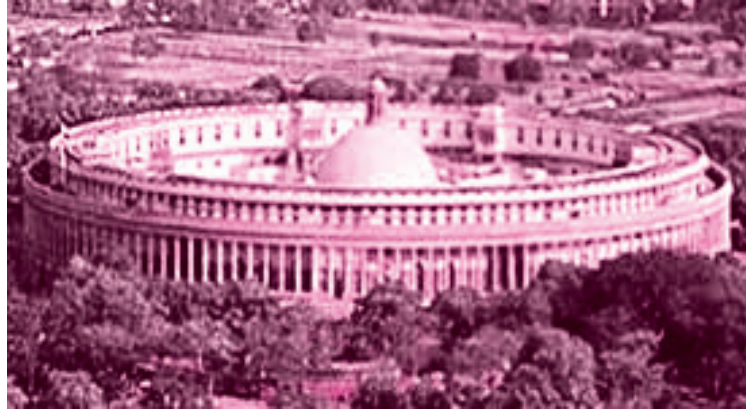
चित्र 22.1: संसद भवन, नई दिल्ली

भारतीय संसद में भारत का राष्ट्रपति तथा दोनों सदन; लोक सभा और राज्य सभा सम्मिलित होते हैं। लोक सभा के सदस्यों का चुनाव सीधे लोगों द्वारा किया जाता है और राज्य सभा के सदस्यों का चुनाव अप्रत्यक्ष रूप से होता है।