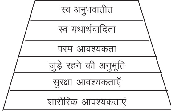
चित्र 18.2: मास्लो की आवश्यकताओं का अनुक्रम

करते हैं जो कि अपनी स्व-अवधारणा के प्रतिकूल होते हैं। विकास के लिए आदर्श परिस्थिति बिना शर्त सकारात्मक संबंध रखना है। व्यक्ति के पूर्णतः कार्यशील के संबंध में उनकी धारणा है कि स्व-अवधारणा लचीला तथा विकासात्मक है। यह मानव जाति के आशावादी विचार को प्रतिपादित करता है।