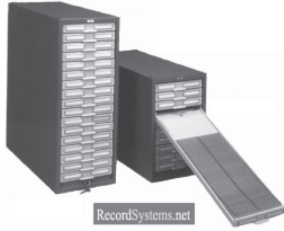
चित्र 4.9 : कार्डेक्स प्रणाली