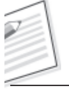
चित्र 4.14 : पत्रिका का परिग्रहण पंजी का नमूना

* इन कॉलम को पत्रिकाओं के संबंध में प्रयोग नहीं किया जाएगा।